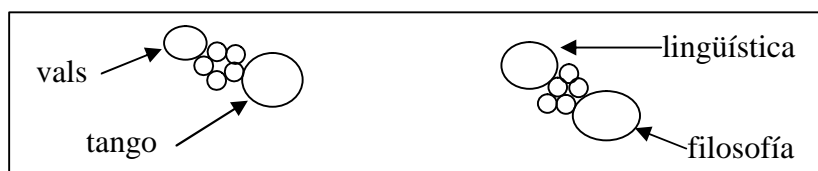
Esquema 2: Conexificación de las áreas de identificación

Los temas de posible identificación de los sujetos no son todos independientes el uno del otro: por ejemplo, si me gustan o no los gatos no es independiente de si me gustan o no los perros. Así, las regiones del mapa que sirve de substrato a la personalidad están potencialmente relacionadas, en el substrato mismo (o sea, independientemente de la personalidad definida en él), de manera que la representación de una personalidad se puede ver como un grafo dentro del mapa, en el cual algunas partes pueden ser conexas y otras no. Así, si a mí me gusta la filosofía y la lingüística y también el tango y el vals, las cuatro regiones ‘coloradas’ de sí que corresponderían a estas inclinaciones en el mapa de mi personalidad, serían conexas dos a dos, como ilustrado en el esquema siguiente.